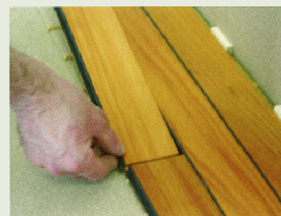
4 – Laua asetamine eelmise laua otsa