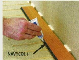
2 – Sulundite liimimine NAVYCOL+-ga