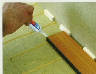
3 – Laua otsa liimimine