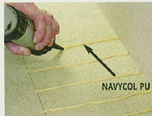
1 – Liimi NAVYCOL triibud

Põrandakatte Navylam+ on lihtsalt puhastatav. Vannitoa puidust põrandakatte NAVYLAM+ värskendamiseks on soovitatav kasutada pihustatavat või purgiõli NAVYHUILE (või analoog) ja pühkida see puhta niiske riidlapiga sisse.