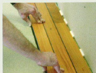
5 – Laua paigaldamine kogu pikkuses