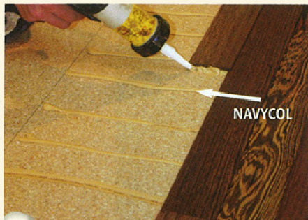
1 – Liimi NAVYCOL triipude kandmine

Laevatekk parkett NAVYLAM® kinnitub omavahel punni ja soone sulundiga. Üle 10 m 2 pinnal tuleb kõikide põrandast välja ulatuvate osade jätta vähemalt 5 mm laiune paisumisvuuk. Parima veekindluse tagamiseks tuleb kõik ots-vuugid liimida liimiga NAVYCOL . Enne põrandal kõndimist ja vuugihermee-tiku Navyjoint paigaldamist laske liimil umbes 12 tundi kuivada.