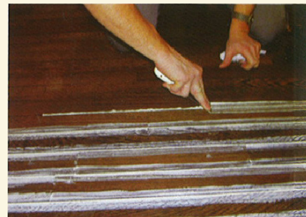
3 – Hermeetiku pahtellabidaga tasandamine